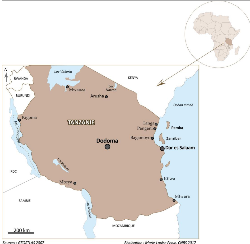
Schéma 1 : carte générale de la Tanzanie

Cette note propose un bilan des enjeux de la multiplication des projets d'investissement qui s'observe en Tanzanie depuis les années 2000 en discutant la nature de ces transactions foncières, les jeux multi-acteurs et les configurations politiques influençant leur mise en œuvre. Il s'agit de s'intéresser à cette marchandisation des terres à partir d'une lecture en termes de politiques publiques, en identifiant les décalages entre la fabrique des politiques de promotion de l'investissement foncier, d'une part, et les limites de l'implémentation des transactions avec des entreprises étrangères, d'autre part. Ainsi, l'objectif est de questionner la dynamique de privatisation de la gestion du foncier, tant promue par les experts des organisations internationales et critiquée par les membres de ladite « société