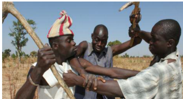
Scène de conflit imaginaire à des fins de sensibilisation

La présente note de capitalisation porte sur l'expérience des instances locales des Hauts Bassins dans la gestion des conflits fonciers ruraux.