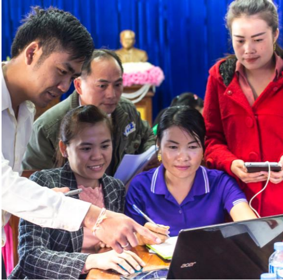
ການຝຶກອົບຮົມ ວິທີການນຳໃຊ້ແທບເລັດເພື່ອຈຸດປະສົງຂອງ IPM ໃຫ້ແກ່ພະນັກງານພາກລັດ

ເຄືອຂ່າຍ RAI ໃນລາວ ແມ່ນເວທີສຳຄັນ ໃນການສົ່ງເສີມການລົງທຶນດ້ານກະສິກຳທີ່ມີຄວາມຮັບຜິດຊອບຢູ່ພາຍໃນ ແລະ ພາກພື້ນ. ເຄືອຂ່າຍດັ່ງກ່າວປະກອບມີຄູ່ຮ່ວມພັດທະນາ ແລະ ອົງການຈັດຕັ້ງທາງສັງຄົມ ເຊັ່ນ GIZ, ອົງການອາຫານ ແລະ ການກະເສດ (FAO), ອົງການສະຫະປະຊາຊາດເພື່ອການພັດທະນາ (UNDP) ແລະ ໂຄງການບໍລິຫານລັດກ່ຽວກັບທີ່ດິນປະຈຳພາກພື້ນແມ່ນ້ຳຂອງ (MRLG) ລວມທັງ ອົງການບ້ານຈຸດສຸມສາກົນ (VFI), Oxfam, Helvetas ແລະ ອື່ນໆ. ເວທີນີ້ມີບົດບາດສຳຄັນໃນການຜັນຂະຫຍາຍການນຳໃຊ້ IPM ເນື່ອງຈາກເປັນເວທີສຳລັບໃຫ້ຄູ່ຮ່ວມພັດທະນາອື່ນໆໄດ້ຮຽນຮູ້ຈາກປະສົບການ IPM ຂອງໂຄງການ ແລະ ອາດຈະສາມາດສະໜັບສະໜູນຄູ່ຮ່ວມງານພາກລັດຂອງເຂົາເຈົ້າ ທາງດ້ານເຕັກນິກ ແລະ ການເງິນ ເພື່ອຈັດຕັ້ງປະຕິບັດກິດຈະກຳທີ່ສອດຄ່ອງກັນ.