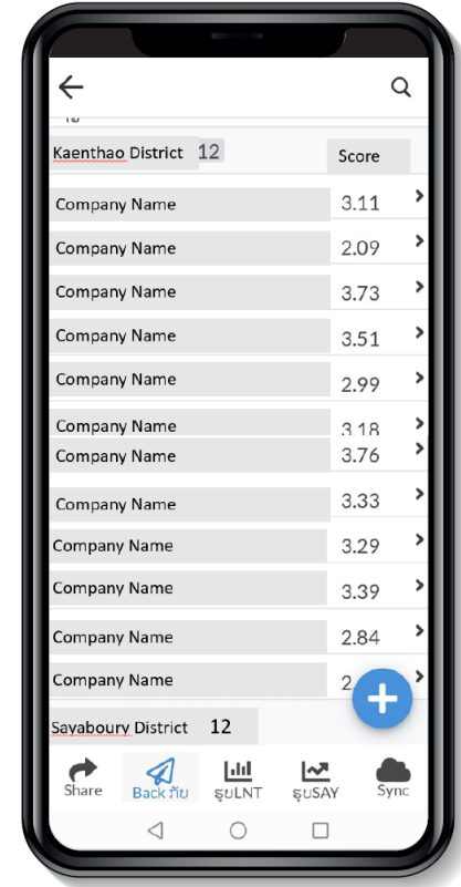
ຕົວຢ່າງຈາກການໃຫ້ຄະແນນໃນຕົວຈິງຂອງບັນດາບໍລິສັດທີ່ລົງທຶນຢູ່ເມືອງແກ່ນທ້າວ, ແຂວງໄຊຍະບູລີ, ໃນລະດັບຄະແນນຈາກ 0 ຫາ 5 (ບໍ່ລະບຸຊື່ບໍລິສັດ)

4. ເຄື່ອງມືດັ່ງກ່າວໄດ້ຮັບການປັບປຸງເທື່ອລະກ້າວ ແລະ ກະຊວງແຜນການ ແລະ ການລົງທຶນໄດ້ສະເໜີໃຫ້ນຳໃຊ້ເຂົ້າໃນການຕິດຕາມປະເມີນຜົນການລົງທຶນ ໃນຂະແໜງອື່ນທີ່ນອກເໜືອຈາກຂະແໜງກະສິກຳ ແລະ ປ່າໄມ້ ພ້ອມທັງສະເໜີໃຫ້ມີການນຳໃຊ້ທົ່ວປະເທດ.