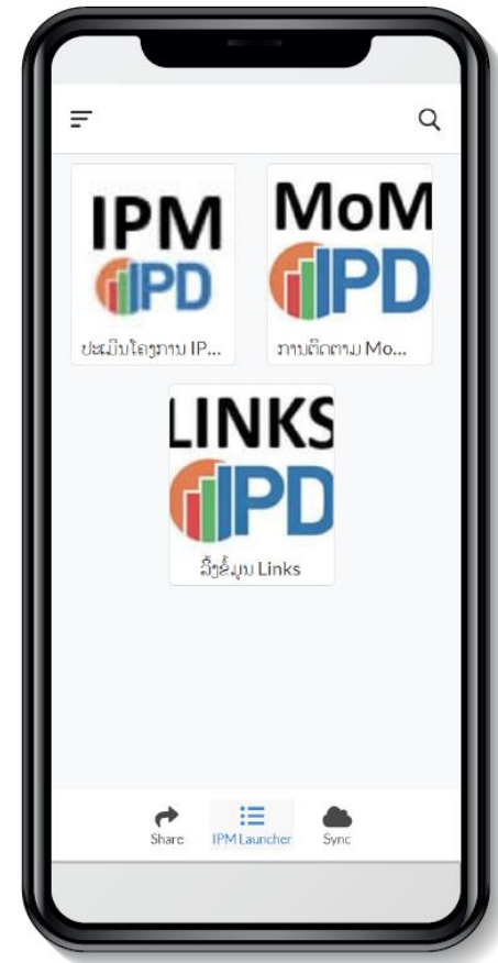
ຮູບພາບໜ້າຕາຂອງແອັບ

ເພື່ອຮັບປະກັນວ່າ ການຮ່ອງທຸກ ແລະ ຂໍ້ສະເໜີ ຂອງຊຸມຊົນທີ່ໄດ້ຮັບຜົນກະທົບ ໄດ້ມີການເກັບກຳຢ່າງເປັນລະບົບ, ບົດບັນທຶກການຕິດຕາມກວດກາ (MoM) ແມ່ນໄດ້ມີການບັນທຶກໃນຮູບແບບດິຈິຕອນເຊັ່ນດຽວກັນ. ຮູບແບບວິທີການຂອງການຕິດຕາມ IPM ເຮັດໃຫ້ຮູ້ວ່າ ທັງ 3 ພາກສ່ວນ (ນັກລົງທຶນ, ຊຸມຊົນທີ່ໄດ້ຮັບຜົນກະທົບ ແລະ ລັດ) ມີບົດບາດສໍາຄັນໃນການຫັນປ່ຽນການລົງທຶນ ໃຫ້ເກີດປະໂຫຍດແກ່ທຸກໆຝ່າຍ.